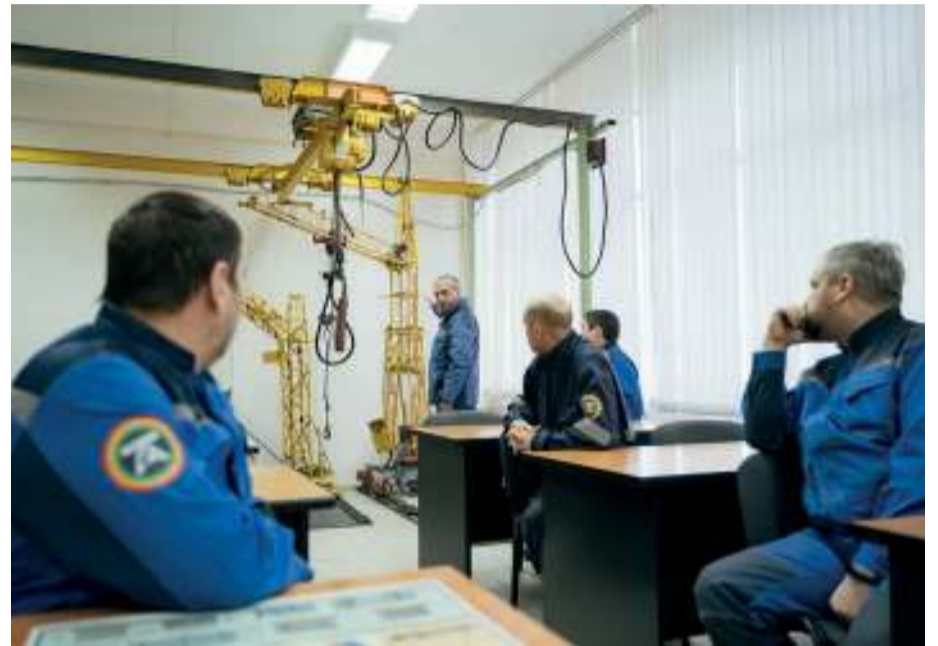
Съёмки для виртуальной экскурсии начались на площадке ТОАЗа в ноябре