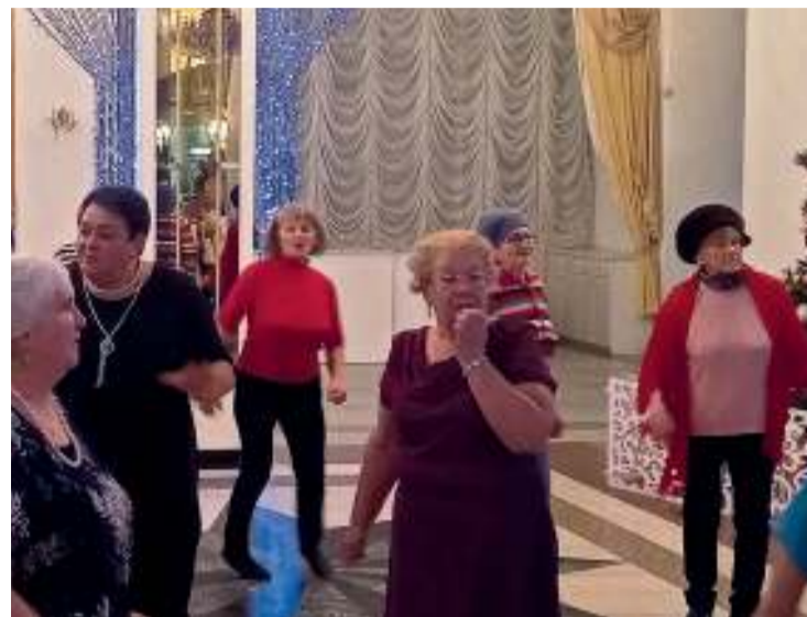
Танцы окрыляют и заряжают оптимизмом

рые, в свою очередь, искажают результаты исследования.