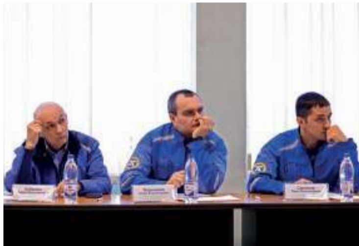
Определить достойного – экспертам задача по силам

Сложно, как у авиадиспетчеров. Ответственно, как на атомной станции. Надёжно – добавляют операторы ДПУ, представляющие ключевую профессию на нашем заводе. 313 операторов дистанционных пультов управления работают сегодня на Тольяттиазоте. Конкурс профессионального мастерства для них провёл совет молодёжи. Свои умения показали молодые специалисты из производственных цехов и их наставники.