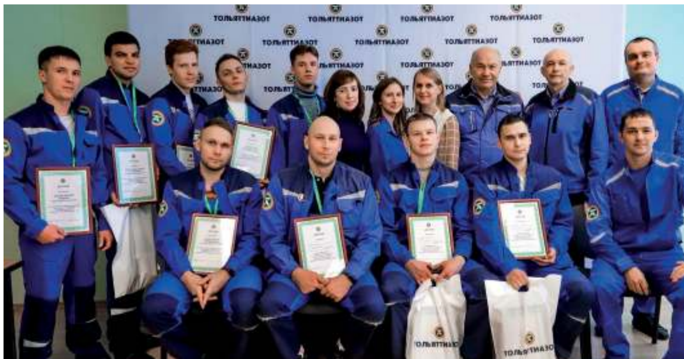
Инициатива и перспектива сопутствуют нашим специалистам