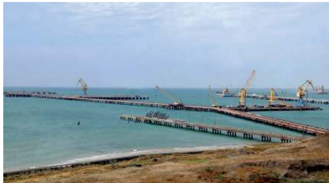
Темрюкский район – уникальное место на карте Краснодарского края: здесь обеспечен выход к двум морям, Азовскому и Чёрному. А через Босфорский пролив путь открыт в любую часть света

Сердцем терминала станут два изотермических хранилища для жидкого аммиака, каждое – объемом 50 тыс кубометров. Продукт будет храниться при температуре минус 33 градуса по Цельсию. Сейчас специалисты